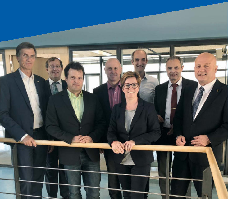
Die Rektoren der HfSW und das Projektteam Master Autonomes Fahren

Jede der Hochschulen verfügt über besondere Wissensträger und exzellent ausgestattete Labore, die in den gemeinsamen Masterstudiengang eingebracht werden.